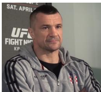
Mirko Filipovic

Mirko Filipovic ist ein kroatischer MMA- sowie K-1-Kämpfer. Er wurde am 10. September 2006 Pride FC „Open-Weight“-Grand-Prix-Sieger und am 30. Dezember 2016 Rizin Openweight Grand Prix Champion.