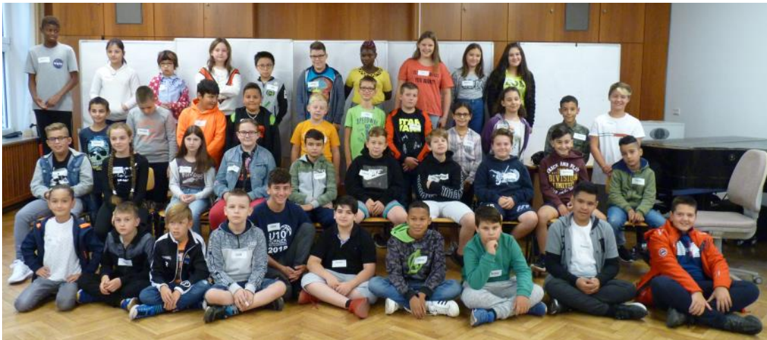
Unsere neuen Fünftklässler